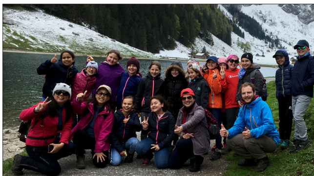
Mittagspause der Klasse beim Seealpsee