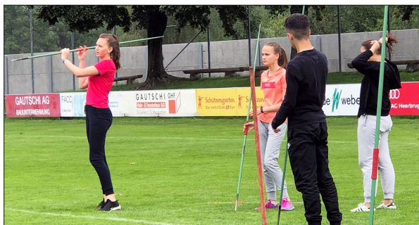
Schülerinnen und Schüler beim Speerwurf am Sporttag

Petrus meinte es am Donnerstag, 6. Juni, gut mit uns, die Witterung war perfekt. Ein Stufenwettkampf war angesagt. Jede Stufe wurde in sieben durchmischte Gruppen aufgeteilt und diese durchliefen verschiedenste