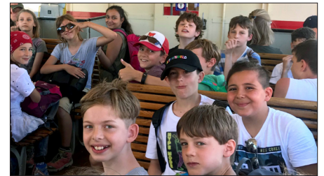
Das Highlight bei der Heidenerbahnfahrt waren die offenen Nostalgiewagen