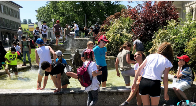
Ein kühlendes Fussbad im Dorfbrunnen nach beachtlich langer Wanderung

Für einmal war es im Schulhaus Wiesenau mucksmäuschenstill, denn die ganze Kinderschar befand sich auf der Schulhausreise ins Appenzeller Vorderland.