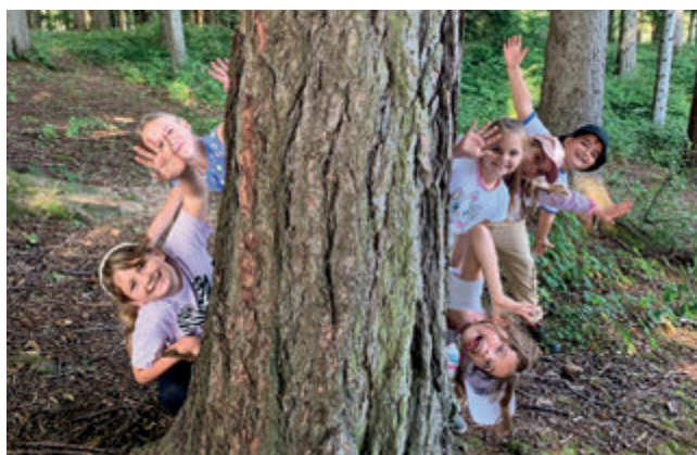
Ausflug in den Wald.