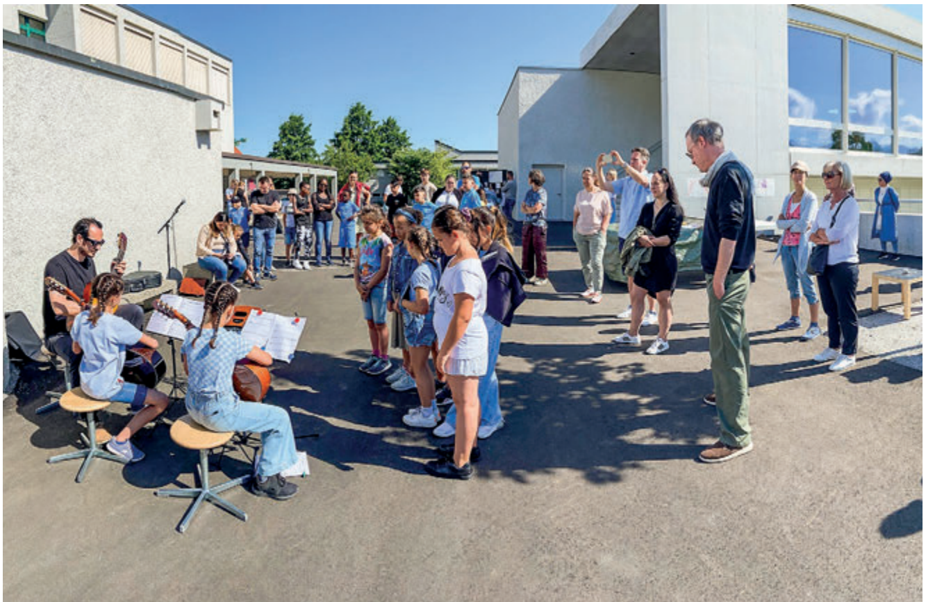
Kreative Schule macht einfach Spass.

Der Aufwand für das Reinigungspersonal wird neu in der Kostenstelle Gemeindekanzlei und Gemeindeamt belastet. Weiters wird das Betriebs- und Steueramt mit einer neuen Sicherheitslösung ausgestattet. Mit der Bereinigung der Anlagebuchhaltung sind die Abschreibungen um Fr. 23'000.- tiefer ausgewiesen.