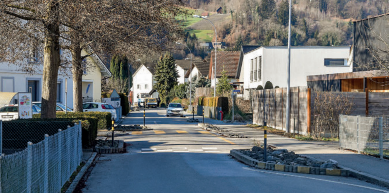
Die Revision der eidgenössischen Signalisationsverordnung hat den Weg geebnet für eine Verkehrsberuhigung in weiteren Wohnquartieren.

Legislaturperiode 2021–2024 hin zu verschieben und einzelne Kostenpositionen nochmals zu überprüfen. Für eine zeitliche Verschiebung des Projekts sprach auch, dass das Restaurant mit Kiosk und Aussenplätzen für eine attraktive Zwischennutzung sanft saniert und instand gestellt wurde. Es wurden wichtige Sofortmassnahmen zur Attraktivitätssteigerung und zur Einhaltung gesetzlicher und betrieblicher Richtlinien umgesetzt. Der Gemeinderat definiert das weitere Vorgehen im 2023.