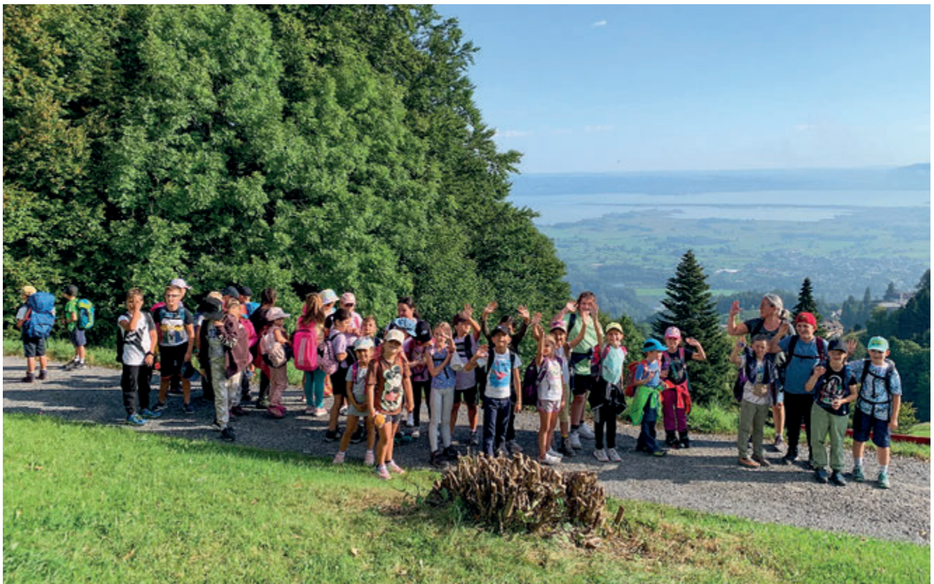
Schulreisen bieten eine willkommene Abwechslung zum Schulalltag.