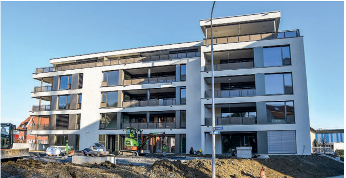
In der Überbauung Wiesen sind 2023 18 neue Mietwohnungen bezugsbereit.

Zur Sicherung einer hochwertigen Zentrumsentwicklung hat der Gemeinderat im Juni 2022 über das Areal der Vukovic Motorsport GmbH eine Planungszone erlassen. In den darauffolgenden Verhandlungen verständigten sich Grundeigentümerin und Gemeinde auf die Durchführung eines offenen Wettbewerbs, um eine architektonisch