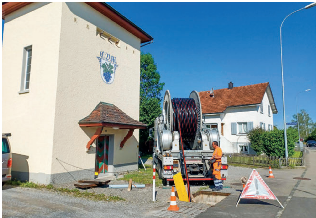
2022 investierten die Technischen Betriebe gut Fr. 760'000.– in die Versorgungssicherheit.

Der Satz für die Feuerwehrabgabe wird für 2023 auf 15% der einfachen Staatssteuer vom Einkommen, maximal Fr. 600.–, festgesetzt (Art. 15 Feuerschutz-Reglement).