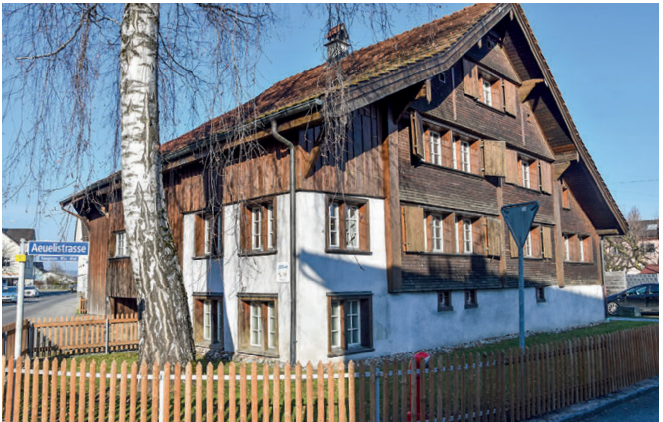
Die Besucherzahlen im Jugendtreff nehmen zu. Die offene Jugendarbeit wird 2023 ausgebaut.

Ein guter Sommer bescherte der Badi viele Gäste. Der Mehraufwand für die Badeaufsicht wurde durch gute Einnahmen mehr als kompensiert. Der Campingbereich bewegte sich auf dem Niveau des Vorjahres. Im 2023 startet das Vorprojekt Erneuerung Schwimmbadtechnik.