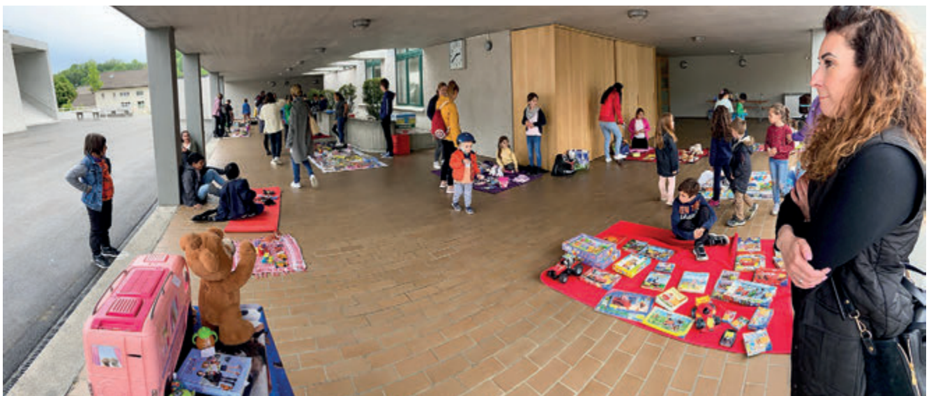
Spiele ausleihen in der Ludothek im Schulhaus Wiesenau.

Das Aufwertungskonzept für einen wirksamen Amphibien-schutz im Natur- und Landschaftsschutzgebiet Esel-schwanz wird weiter umgesetzt.