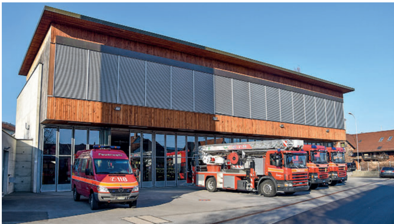
2023/24 wird entschieden, wie die Feuerwehr der Zukunft im Unteren Rheintal organisiert wird.

und ortsbaulich hochwertige Umnutzung und Neuüberbauung des Areals zu sichern. Das Ergebnis liegt Mitte 2023 vor.