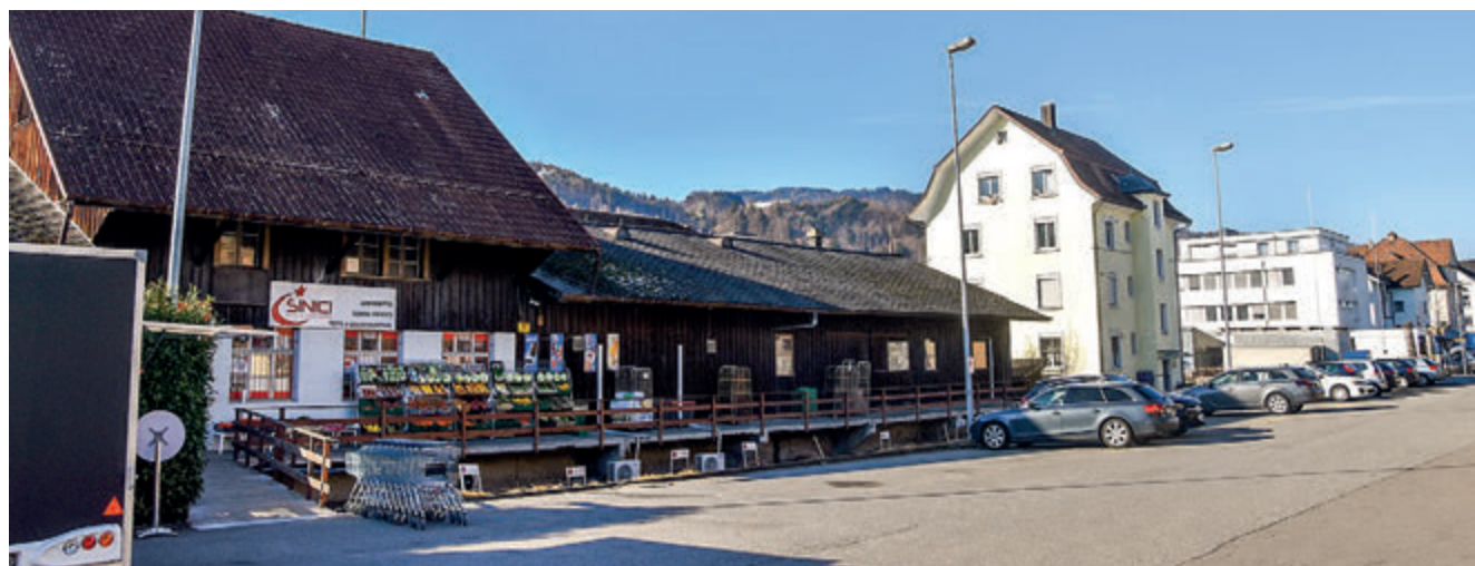
Auf dem Güterbahnhof-Areal ist eine hochwertige Quartierentwicklung mit Mischnutzung vorgesehen.

Die Sondernutzungsplanung für das Güterbahnhof-Areal (Areal Alp), wo der Schreinerverband des Kantons St.Gallen seine Schul- und Kursstandorte in einem Schreiner Kompetenzzentrum St.Margrethen konzentrieren will, durchlief im Berichtsjahr die kantonale Vorprüfung und die Mitwirkung. Beide Prozesse führten zu kleineren Anpassungen. Die öffentliche Auflage des Gesamtpakets ist Mitte Februar 2023 terminiert. Die Sondernutzungsplanung schafft die Grundlage für eine verdichtete hochwertige Quartierentwicklung direkt beim Bahnhof.