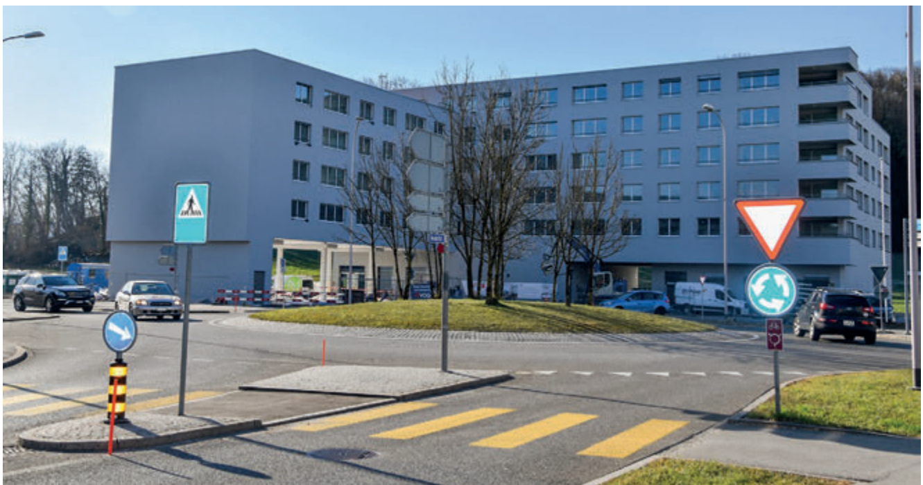
2022 wurde kräftig in den Wohnungsbau investiert.