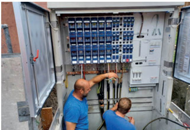
Die EW-Verteilkabine Kirchenau wird angeschlossen.