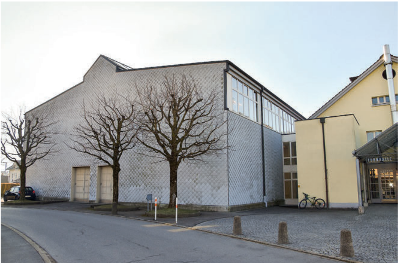
2023 entscheidet die Bürgerschaft über die Instandsetzung der Rheinauhalle.