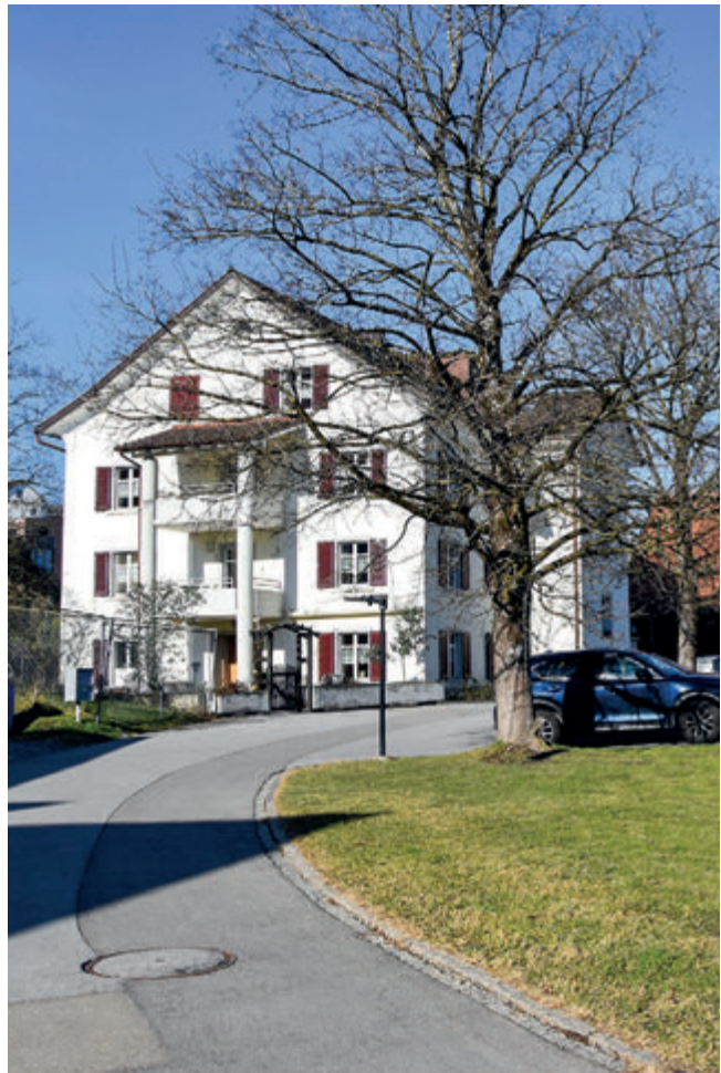
In den nächsten zweieinhalb Jahren wird das Haus Rosengarten des Alters- und Pflegeheims Fahr mit einem Annexbau erweitert und saniert.

Erstmals wurde im Berichtsjahr der Bushof planmässig beschrieben. Die Aufwandszunahme beläuft sich auf Fr. 145'000.–. Die Ausgaben für den öffentlichen Verkehr sind gegenüber dem Budget um Fr. 50'000.– höher ausgefallen.