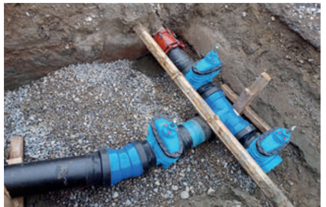
Die Hauptwasserleitung (Hauptstrasse-Neulandstrasse) mit Schieberkombination wird erneuert.