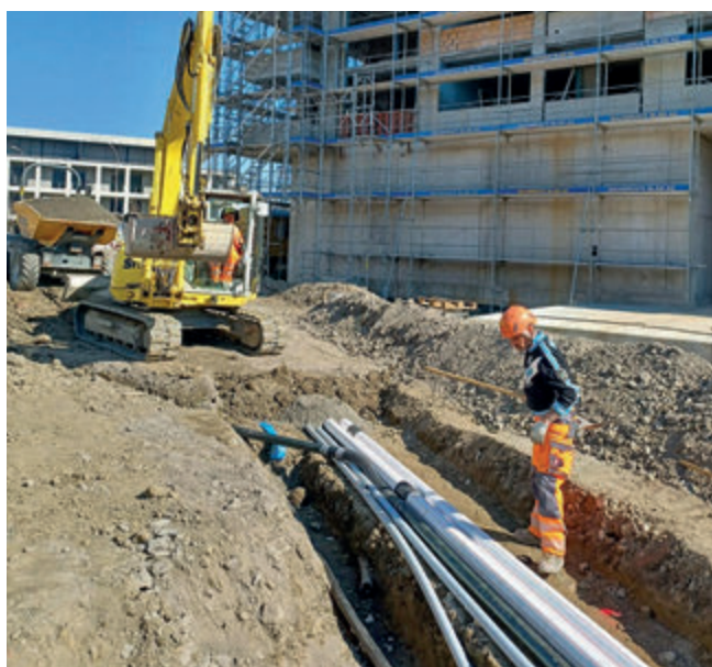
Die Anzahl der Erschliessungsprojekte der Technischen Betriebe hat sich stark erhöht.

In der Erfolgsrechnung 2022 des Allgemeinen Gemeindehaushalts resultiert ein Ertragsüberschuss von Fr. 2,99 Mio. Budgetiert war ein Aufwandüberschuss von Fr. 0,23 Mio.