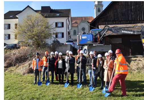
Spatenstich beim Rosengarten vom 21. Februar 2023

Er ermöglicht eine sichere Zu- und Wegfahrt in die Fahrstrasse. Der ganze Platz wird mit einem Bauzaun gesichert. Wenn es die Witterungsverhältnisse zulassen, beginnen Ende