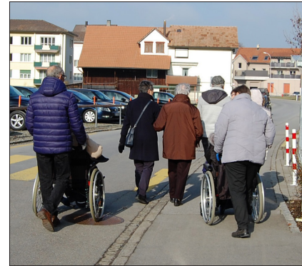
Die Rollstuhlgruppe wuchs dank mehr HelferInnen merklich