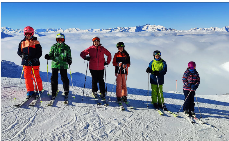
Das pure Glück für die, die ob dem Nebelmeer sind und allerschönsten Sonnenschein geniessen dürfen

Sarina Braunwalder Pressegruppe Rosenberg