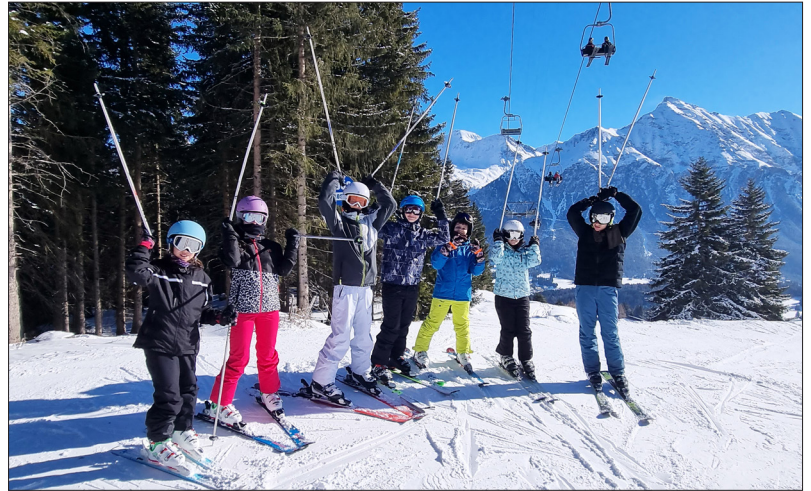
Das Titelbild hat es verraten: Das Rosenberg-Winterlager fand im Bündnerland statt

Kaum zu glauben, aber wahr! Der Schnee kam wie gewünscht zur richtigen Zeit und erfreute nicht nur die vielen Kinderherzen, sondern auch jene ihrer Lehr- und Begleitpersonen. Seit Wochen nämlich fieberten sie alle auf dieses Skilager hin. Während die Kinder der 6. Klasse schon letztes Jahr ihre ersten Erfahrungen im Winterlager sammeln konnten, standen diese den 5.-Klässlern noch bevor. Nervosität und Aufregung waren jedoch bei allen spürbar, ganz besonders, als es nach dem Zimmerbezug im Lagerhaus «Casa Fadail» und feinem Mittagessen zur Piste losging. Für einige Schülerinnen und Schüler war das Skifahren nichts Neues. Einzelne mussten sich erst wieder an diesen Sport gewöhnen, bevor auf dem Stand des Vorjahres weitergearbeitet werden konnte, und wiederum andere machten wirklich ihre ersten Erfahrungen mit zwei Brettern unter ihren Füßen. Doch alle bauten dank