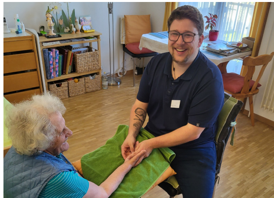
Das Fahr wird immer mehr zur Wohlfühlphase

Zum Gebotenen gehören unter anderem Musik und Geschichten unter dem Titel «Geschichten, die bewegen», welche sowohl im Haupthaus als auch im Rosengarten stattfinden. Diese Momente schaffen Gemeinschaft, regen das Erinnern an und bieten allen Bewohnenden einen Zugang, unabhängig von Mobilität oder kognitiven Fähigkeiten. Ergänzt wird dies durch das betreute Krafttraining, das auch von Externen genutzt wird, sowie durch gemeinsames Singen,