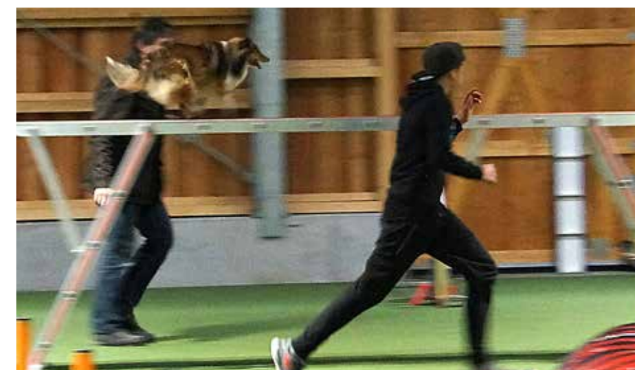
Impression einer Trainingseinheit.

eingebaute Ablenkungen. (Der Parcours führt nicht über das nächstgelegene Hindernis, sondern beispielsweise dasjenige dahinter). Dadurch wird der Parcours