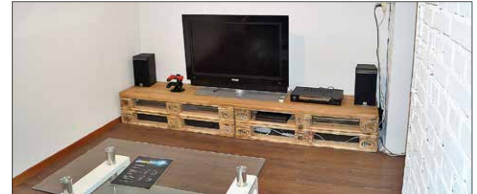
Gemütliches Zocken in der Gamerlounge...