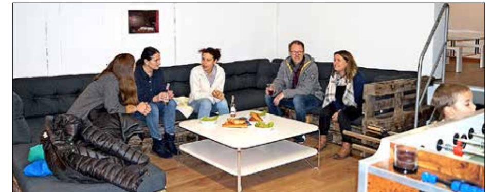
An der Neueröffnung waren ausnahmsweise auch Erwachsene in die Chill Jugendlounge eingeladen.

Nach dem Jugendtreff, der für Kinder ab der sechsten Klasse bis ca. 3. Sekundarstufe gedacht ist, findet sich in St. Margrethen kein öffentlicher Treffpunkt für den Ausgang. Der Hauptgedanke der Betriebsgruppe ist, die Jugendlichen von der Strasse zu holen. Die Chill Jugendlounge soll eine zweite Heimat für die Jungen werden. Im Chill haben alle 16- bis 22-Jährigen die Möglichkeit, sich in einem sicheren Ambiente zu treffen. Es soll eine Win-Win-Situ-