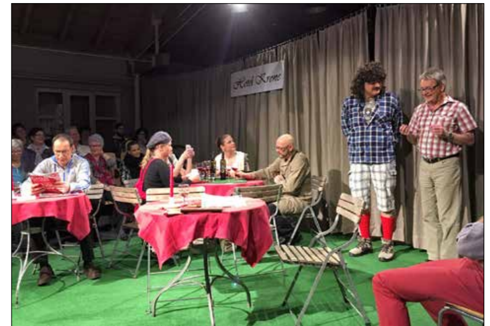
Eine Szene von der letzten Produktion 2017 «Verkleidet»