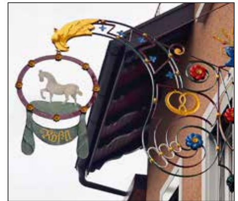
Das Wirtshauschild weist darauf hin, dass das Rössli wieder geöffnet ist.

Am 11. November 2017 war dann endlich der lang erwartete Augenblick gekommen und das Rössli konnte wieder eröffnet werden. Zu diesem Anlass waren alle Genossenschafter eingeladen und als kleines Zückerchen für die lange Wartezeit erhielt jeder einen Gutschein von Fr. 5.00, der im Rössli für Konsumation eingelöst werden kann. Alle Gaststuben waren denn an diesem Tag bis auf den letzten Platz gefüllt und den vielen Gästen gefiel das erneuerte Rössli, das seinen ganzen Charme von früher behalten hat, ausgesprochen gut. Der