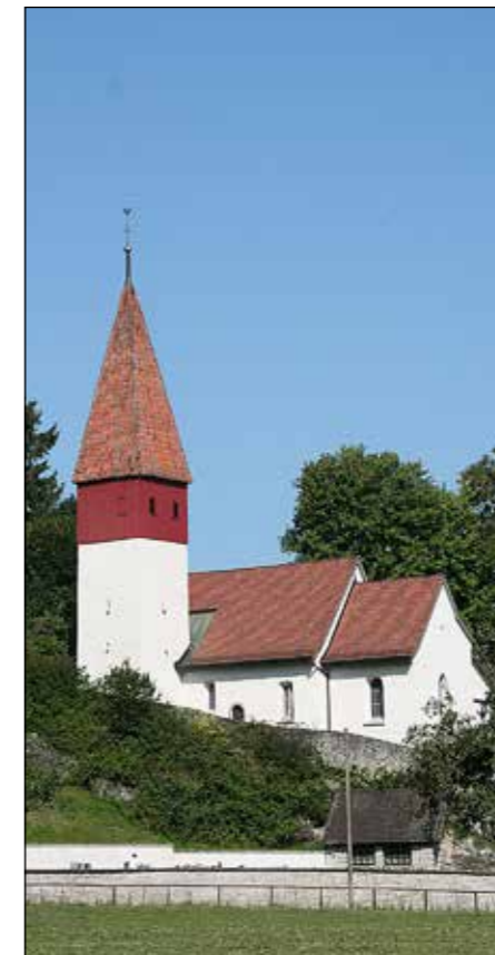
Das Alte Kirchlein: Während gegen 300 Jahren von Katholiken und Evangelischen paritätisch genutzt.

Das Zusammenleben der evangelischen und der katholischen Bevölkerung war lange Zeit nicht konfliktfrei. Trotzdem darf man feststellen, dass man hierorts vergleichsweise tolerant war. Nebst der jahrhundertelangen gemeinsamen Nutzung des Alten Kirchleins darf als Beispiel auch der Zusammenschluss der Schulen 1904 erwähnt werden, der in anderen Gemeinden bis 1972 auf sich warten liess. Heute besteht ein entspanntes Verhältnis zwischen den Konfessionen. Das Miteinander und das Gemeinsame haben trotz der Verschiedenheiten an Bedeutung stark zugenommen.