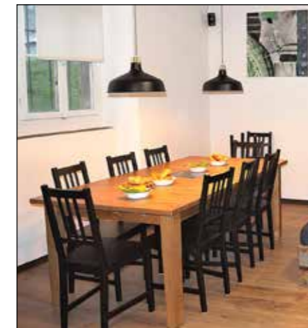
...oder Gespräche am einladenden Tisch. Die Chill Jugendlounge bietet viele Unterhaltungsmöglichkeiten.

Geöffnet hat die Jugendlounge Chill jeweils am Freitag von 17.30 bis 0 Uhr. Das Alter ist von 16 bis 22 Jahren. Während der Öffnungszeiten sind immer mindestens zwei Mitglieder der Betriebsgruppe anwesend und achten darauf, dass die Zusammenreffen in einem lustigen Abend und nicht im Desaster endet.