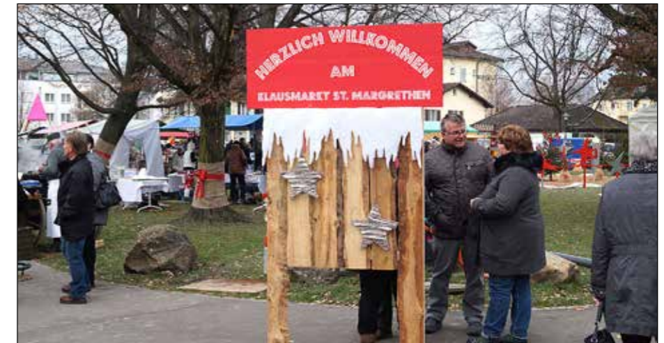
Marktreiben am 4. Dezember 2017 bei ca. 2 Grad Aussentemperatur.

Das Mosaik war auch mit dabei dieses Jahr. Nein, nicht etwa vertreten an einem Stand, sondern mobil und mit der Kamera ausgerüstet. Unser Ziel: einige Impressionen und Meinungen der Marktbesucher festzuhalten.