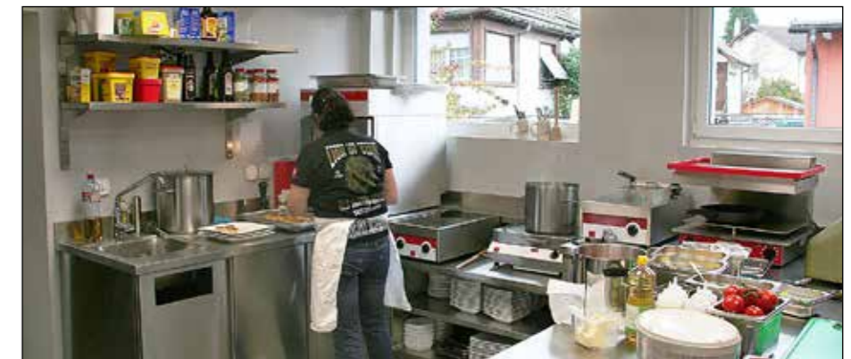
Die praktisch eingerichtete neue Küche entspricht nun wieder den heutigen Anforderungen.