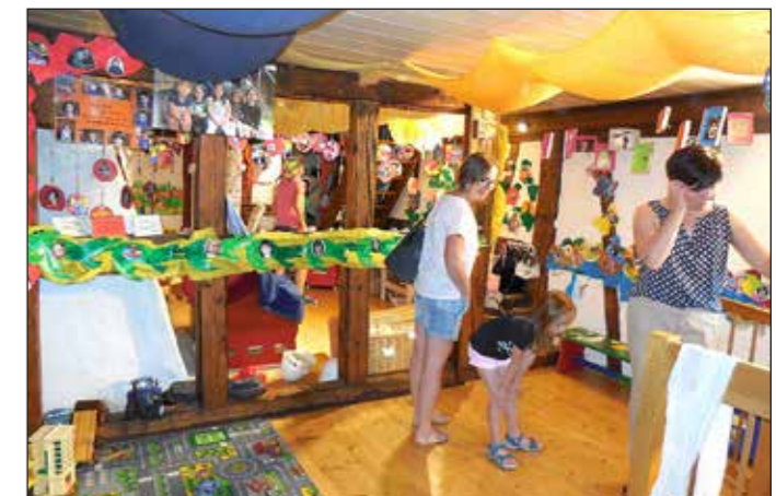
In der Spielgruppe Wundertüte.