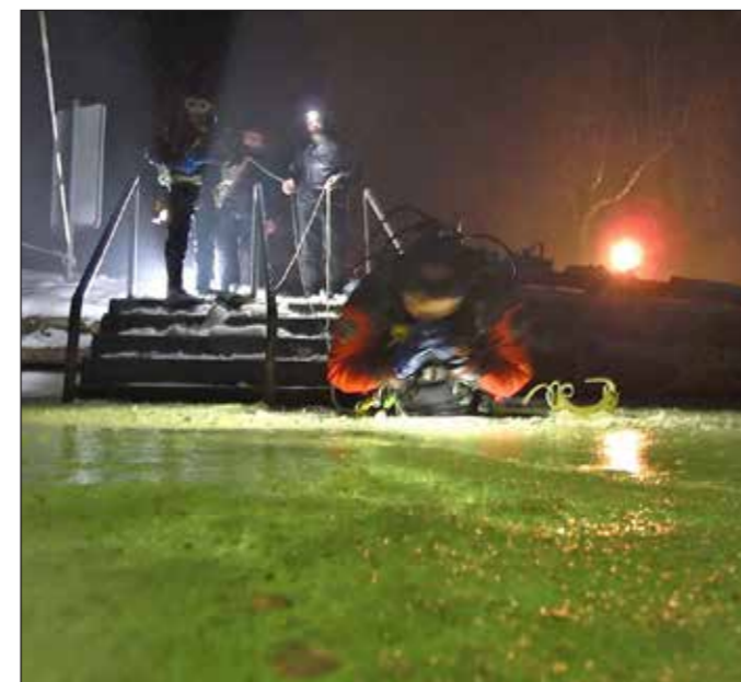
Beleuchtungstest vor dem Nachtauchgang.