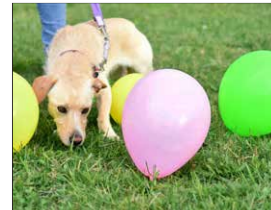
Der Hund auf Entdeckungsreise während einem Kurs.

Für die Vereinspräsidentin ist ein Hund ein treuer Freund, der einem immer akzeptiert, wie man ist, und sofort Freude zeigt, wenn er einem sieht. Ein Hund kann ein Ersatz für einen Menschen sein, einen Ansporn zum weiterleben und ein Trostpflaster in schlechten Tagen. Auch «zwingt» er einem täglich, an die frische Luft zu gehen, was erstens die Gesundheit fördert und zweitens den sozialen Kontakt zu anderen Menschen oder Hundebesitzern pflegt.