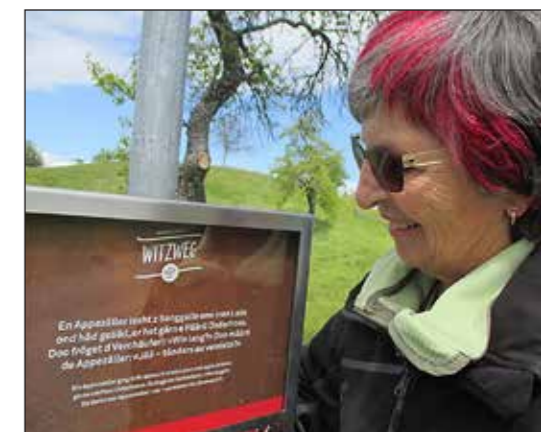
Wandern, lachen, die Natur geniessen... Der Appenzeller Witzwanderweg gehört zu den beliebtesten Themenwegen der Schweiz.

(www.witzweg.ch, www.appenzellerland.ch, Tourist Information Heiden: T 071 898 33 01)