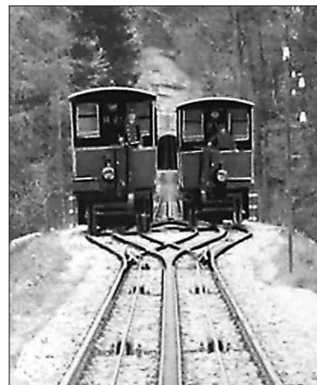
Der Achsenbruch vor 60 Jahren trug sich im Bereich der Brücken über die Hexenkirchli-Schlucht zu, wo sich die beiden Wagen der alten RhW kreuzten.

Der 1. Mai 1958 war ein schöner Donnerstag mit recht vielen Ausflüglern. Beim Start der beiden Wagen deutete nichts auf den aussergewöhnlichen Zwischenfall hin. Plötzlich aber krachte es unweit der Kreuzungsstelle, und gleichzeitig standen beide Wagen bockstill. Sofort war klar, dass beim talwärts fahrenden eine Achse gebrochen war. Die erschreckten und verängstigten Passagiere wurden von den beiden Wagenführern auf den sicheren Boden gebracht, und zum Glück waren keine Verletzten zu beklagen. Der grosse Schaden beschleunigte den Bau der neuen Bahn, die schon vorher geplant gewesen war. Die Eröffnung erfolgte Ende 1958.