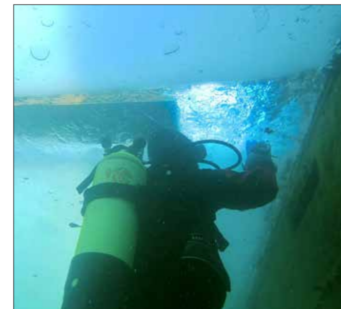
Tauchgang unter der Wasser- und Eisoberfläche.