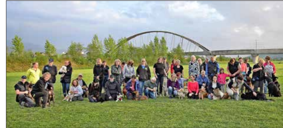
Die Vorstands- und Vereinsmitglieder mit ihren Lieblingen.

Seit 70 Jahren begleitet nun der St. Margrether Verein Hundebesitzer mit professionellen Kursen, die von ausgebildeten Trainern unterstützt werden. Der Verein möchte den Hundebesitzern zeigen, was es heisst, einen Hund zu besitzen, und wie man ihn am besten erziehen kann.