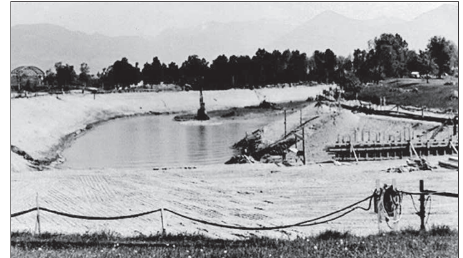
Aushebung des Weihers für den Bau der Autobahn anfangs 60er Jahre.

Die tiefste Stelle befindet sich ungefähr in der Mitte des Weihers und beträgt etwa 10 Meter. Viele Lebewesen, wie zum Beispiel Krebse, Rotaugen und Hechte haben ihren Lebensraum darin gefunden. Auch Barsche und Karpfen sind oft anzutreffen. Keine Sorge, all diese Tiere sind für die Besucher völlig ungefährlich. Um die folgende Bilderserie über die Unterwasserwelt des Weihers einzuleiten, bleibt nichts weiter zu schreiben als: «Bilder sagen mehr als tausend Worte».