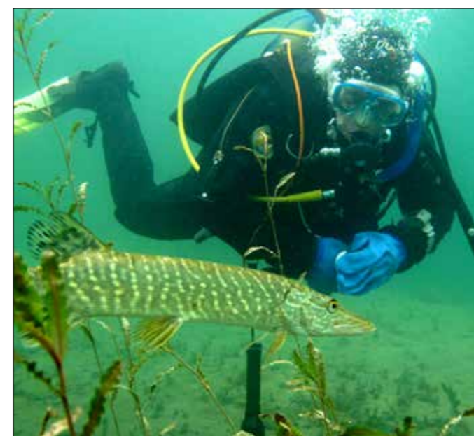
Mensch zu Gast beim Hecht..