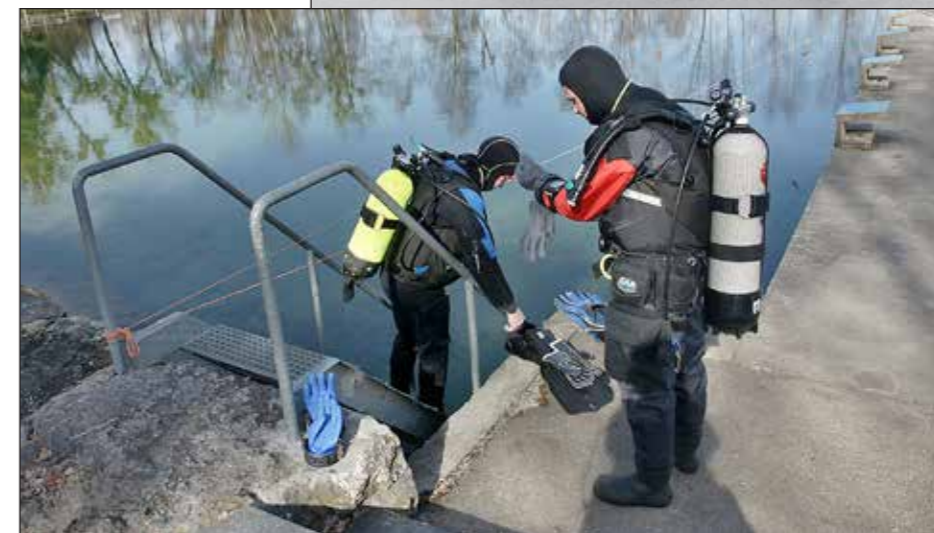
Vorbereitung zu einem Tauchgang bei kühlen Temperaturen im Trockentauchanzug.